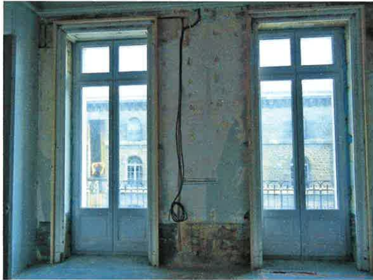
Doublage intérieur des pièces sur rue : avant et après.